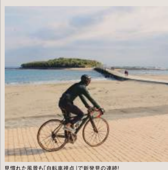
見慣れた風景も「自転車視点」で新発見の連続!

自転車でも各地の魅力を満喫! 宮崎県でサイクリズム推進中! 宮崎県は、温暖な気候に加え、青島や霧島連山などの美しい景色や、そこかしこに散らばる歴史や伝統文化が、サイクリングの魅力。その楽しさや、サイクリングの楽しさを、ぜひ体験してほしい。 その中で、宮崎県は、自転車の総合的な活用を推進する。1999年9月に策定した「宮崎県自転車活用推進計画」を、2019年9月に改定した。その中で、サイクリングの推進に力を入れている。また、サイクリングの楽しさを、ぜひ体験してほしい。